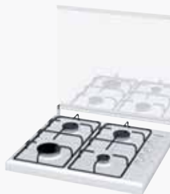
Table de cuisson à gaz